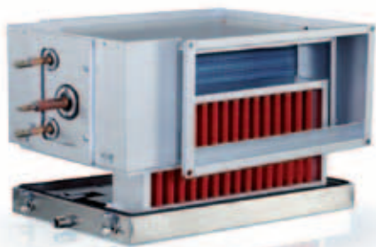
PGDX z zamontowanym separatorem wody, DE

Chłodnica kanałowa PGDX przeznaczona jest do montażu w poziomym kanale o dowolnym kierunku przepływu powietrza (węzownice rewersyjna).