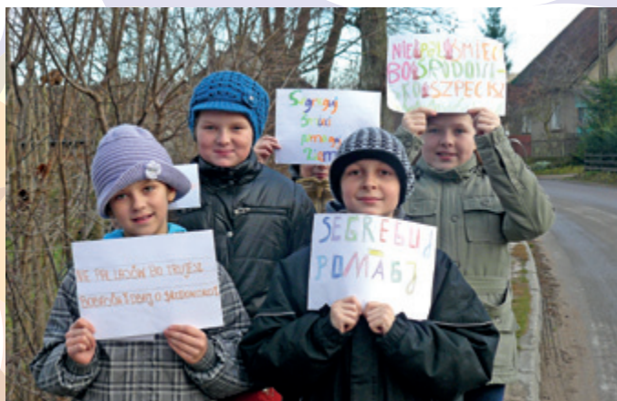
Szkoła Podstawowa w Stożnem

W ramach akcji Dzień Czystego Powietrza przedszkolaki z Niepublicznego Przedszkola w Golinie postanowiły wszcząć alarm! Zanim jednak wyszły na ulice solidnie się do tego przygotowały. Przez kilka dni w poszczególnych oddziałach odbywały się zajęcia na temat szkodliwości spalania śmieci w domowych piecach. Zajęcia prowadzone przez nauczycielki miały na celu uświadomienie dzieci co wolno palić w domowym piecu, a czego pod żadnym pozorem nie wolno do pieca wrzucać. Była też mowa o szkodliwych substancjach, które wydobywają się do atmosfery