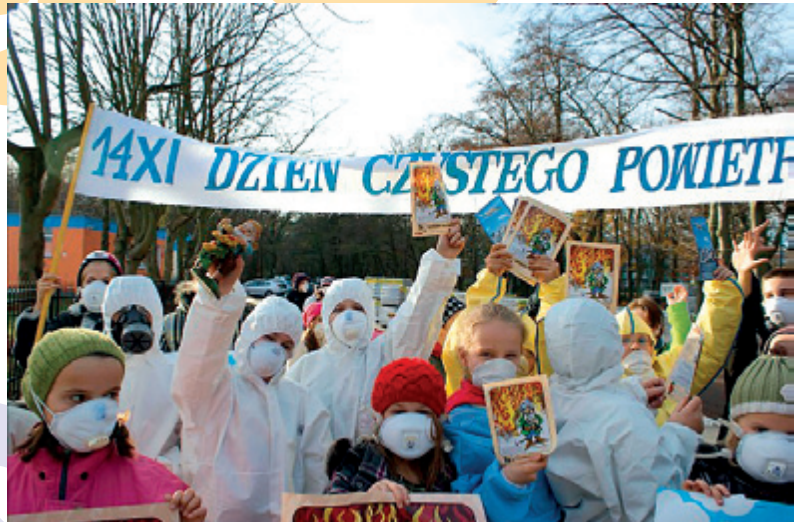
Szkoła Podstawowa nr 5 im. Jana Pawła II w Kołobrzegu