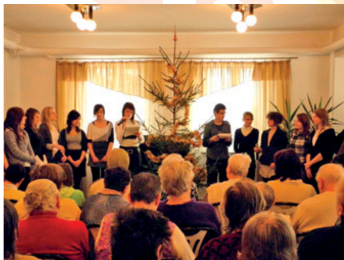
Choinki Nadziei we Włoszczowej. I LO im. Władysława Sikorskiego w Domu Pomocy Społecznej

Szkoła Podstawowa nr 1 im. Janusza Korczaka w Szprotawie pierwszy raz przyłączyła się do akcji „Choinka Nadziei” Fundacji