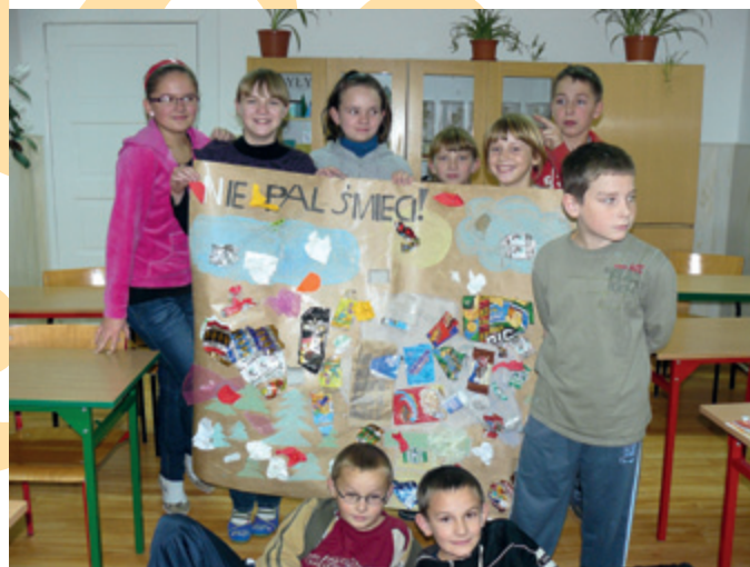
Szkoła Podstawowa w Stożnem

17 listopada przyłączyliśmy się do ogólnopolskiej akcji ekologicznej z okazji VI Dnia Czystego Powietrza. Najpierw obejrzelśmy film edukacyjny Fundacji Ekologicznej ARKA, później klasa V zaprezentowała się w przedstawieniu „Na żywo z Rudoltowic...” Uczniowie wcielili się w role lekarza, strażnika miejskiego, kominiarza, ekologa, krasnoludków, profesora, nauczyciela przyrody, którzy podczas wywiadu telewizyjnego przekonywali o szkodliwości palenia śmieci w piecach domowych. Na zakończenie przeszliśmy wszyscy w barwnym pochodzie ulicami naszej miejscowości, rozdawaliśmy samodzielnie wykonane ulotki i informowaliśmy wszystkich o akcji. W tym dniu nad naszymi głowami nie unosił się dym z kominów, lecz powiewały transparenty z hasłami: „Dzień Czystego Powietrza”, „Kochasz dzieci – nie pal śmieci” i „To nie krasnoludki palą