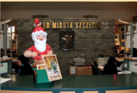
Krasnal UM w Szczecinie