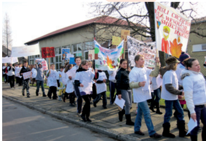
Szkoła Podstawowa, Białdolino Raclawickie

W dniu 15 listopada 2010 r. uczniowie naszego gimnazjum już po raz czwarty brali udział w happeningu ulicznym z okazji obchodów Dnia Czystego Powietrza. Hasłem przewodnim naszego