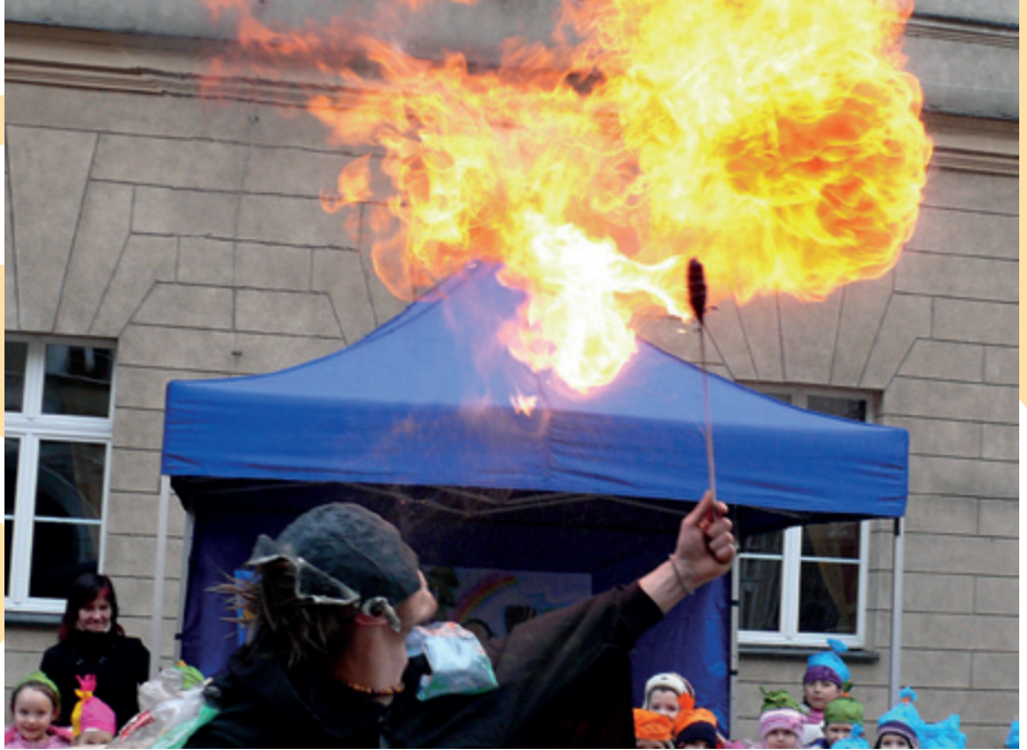
Happening w Opolu

waniem będą dalej szerzyły potrzebę ochrony przyrody i czystego powietrza.”