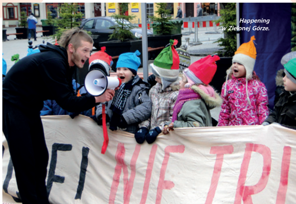
Happening w Zielonej Górze.