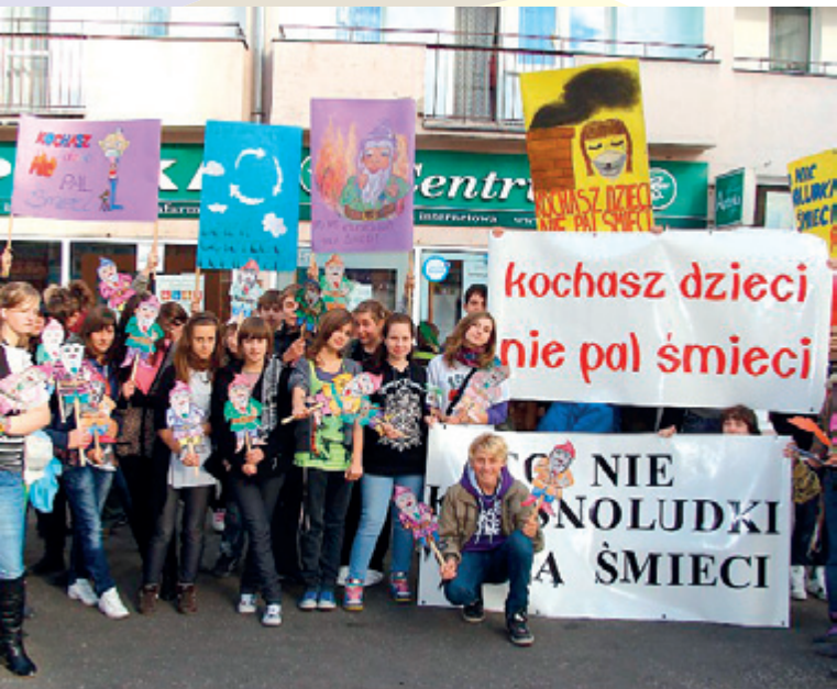
Gimnazjum nr 3 im. Żołnierzy Armii Krajowej w Nysie