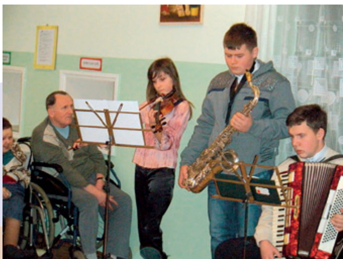
Szkolny Klub Wolontariatu ze Smardzewic w Domu Pomocy Społecznej nr 1 w Tomaszowie Mazowieckim