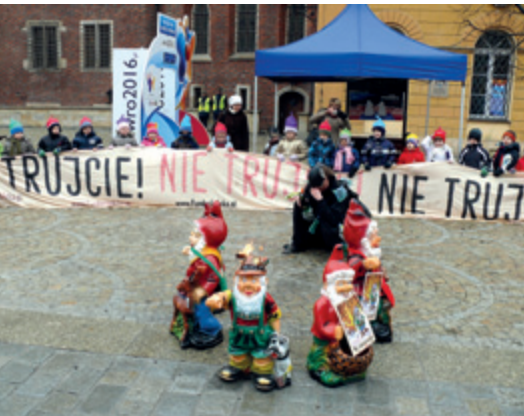
Happening we Wrocławiu

„Czas przedszkolny do najlepszy okres do wyrabiania nawyków i przekonań małego dziecka. Stąd wszelkie działania wdrażające wiedzę np. ekologiczną są godne poparcia. Jeśli są jeszcze zrealizowane w sposób, jaki zrealizowała je Arka, swobodny, przystępny dla dzieci, nastawiony nie na pouczanie, a wspólne działanie, to wiedza, jaką wskazano dzieciom, ma szansę zostać przyswojona jako przekonanie. Za szczególnie atrakcyjny uznalabym happening, który dzieci mocno przeżyły i identyfikowały się z głoszonymi treściami. Również pozostawione w placów-