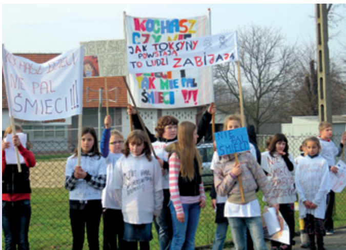
Szkoła Podstawowa, Białdolino Raclawickie

Podczas tegorocznych obchodów Dnia Czystego Powietrza udało nam się zorganizować kilka tematycznych akcji w różnych miastach Polski, lecz to dzięki zaangażowaniu uczniów i nauczycieli z różnych zakątków naszego kraju to ustanowione przez nas na 14 listopada święto jest wciąż żywe! W tym roku hasłem przewodnim tego dnia stał się tytuł naszej nowej kampanii, „To nie krasnoludki palą śmieci”, co spodobało się zarówno kadrze nauczycielskiej, jak i ich podopiecznym. Zainspirowani naszymi pomysłami na rozmaite działania, szkoły zorganizowały różnego rodzaju akcje, służące zwróceniu uwagi społeczeństwa na problem spalania śmieci. Oto kilka przykładów tego, w jaki sposób edukując najmłodszych możemy edukować starszych i tym samym pomagać chronić otaczające nas środowisko.