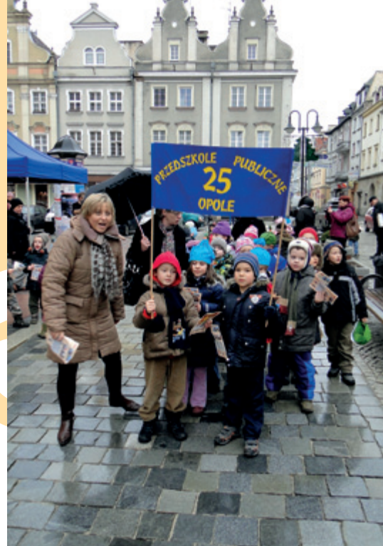
Happening w Opolu

Dodatkowo w dniach od 9 do 21 lutego dla odwiedzających Auchan Kołbaskowo oraz Galerię Gryf zaprezentowaliśmy naszą wystawę edukacyjną. Zabawne figurki krasnali stanęły w następujących miejscach: Pałacu Młodzieży, Domu kultury Słowianin, Książnicy Pomorskiej oraz Urzędzie Miasta Szczecin. Dnia 9 lutego w Przedszkolu Publicznym nr 4 w Szczecinie odbyły się warsztaty edukacyjne, na których dzieci uczestniczyły w prezentacji poświęconej problemowi palenia śmieci w piecach domowych. Wspólna współpraca na warsztatach zawocowała poszerzeniem wiedzy dzieci na tematy związane z ekologią oraz interesującym przedstawieniem.