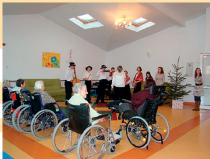
Choinki Nadziei w Elblągu. SOSW nr 1 w Domu Pomocy Społecznej

Od lat promujemy akcje ekologiczne. W tym roku po raz drugi Ekozespoły w Szkole Podstawowej w Zwiniarzu włączyli się w społeczną akcję organizowaną przez Fundację ARKA „Choinka nadziei”. Uczniowie przygotowali jasełka związane tematycznie z okresem Świąt Bożego Narodzenia, które dnia 21.12.2010 r. przedstawili pensjonariuszom Domu Pomocy Społecznej w Grodzicznie. Nasi utalentowani artyści prócz śpiewu i muzyki zawieźli, zgodnie z ideą akcji, ekologiczny stroik oraz dla każdego z pensjonariuszy własnoręcznie wykonane życzenia. Spotkaniu towarzyszyła sympatyczna atmosfera, uśmiech, oklaski i wiara w to, że za rok spotkamy się ponownie. Poczuliśmy się bardzo