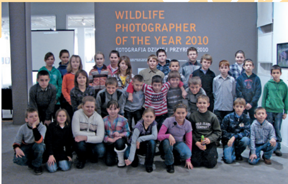
Szkola Podstawowa nr 8 w Rudolłowicach

W ramach wystawy, spośród tych wspaniałych zdjęć przeprowadziliśmy szereg warsztatów edu-