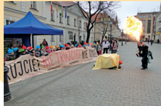
Happening w Zielonej Górze

Edukowanie nie skończyło się jednak na happeningu. Wyposażone w worki z ulotkami informacyjnymi krasnale ustawione zostały w kilku miejscach w Warszawie, aby uwrażliwić ludzi na problem palenia śmieci, a zwłaszcza plastików, w piecach domowych. Krasnale do 30 listopada spotkać można było m.in. w Ministerstwie Środowiska, budynku AGORA S.A., Centrum Handlowym Blue City, Centrum Artystycznym Radomska 13, restauracjach