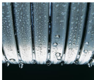
Wyjątkowo trwały i niezawodny wymiennik ciepła Inox-Radial z wysokojakościowej stali szlachetnej

Radiowe zdalne sterowanie Vitotrol 100 typ UTDB-RF2 w pakiecie pogodowym z czujnikiem temperatury zewnętrznej – pakiet zapewnia komfortową regulację pogodową z możliwością ustawiania programów czasowych ogrzewania i c.w.u. Zdalne sterowanie Vitotrol 100 typ UTDB-RF2 komunikuje się drogą radiową z kotłem Vitodens 100-W dlatego nie ma konieczności stosowania przewodów elektrycznych.