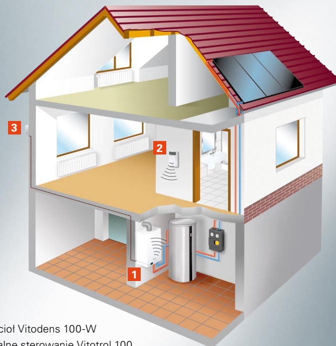
Schemat instalacji kotła Vitodens 100-W z regulatorem UTDB-RF2 i czujnikiem temp. zewnętrznej

System elektronicznej regulacji w kotle Vitodens 100-W w wersji dwufunkcyjnej zapewnia wysoką wydajność (15,2 litrów/min. przy kotle do 35 kW) i stabilną temperaturę c.w.u. Po włączeniu funkcji KOMFORT w kotle dwufunkcyjnym utrzymywana jest wymagana temperatura wody użytkowej, dzięki czemu ciepła woda dostępna jest od razu. W wersji jednofunkcyjnej kocioł oferowany jest również w atrakcyjnych cenowo zestawach pakietowych ze zbiornikiem c.w.u. o pojemnościach: 100, 120 lub 150 litrów, a także w zestawach pakietowych z kolektorami słonecznymi.